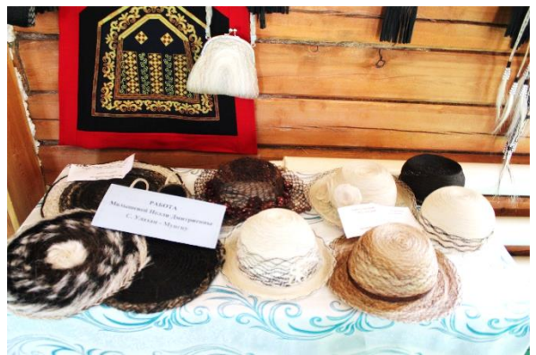
Олекминский район, с. Улахан-Мунгку. Работы народных мастеров и умельцев села