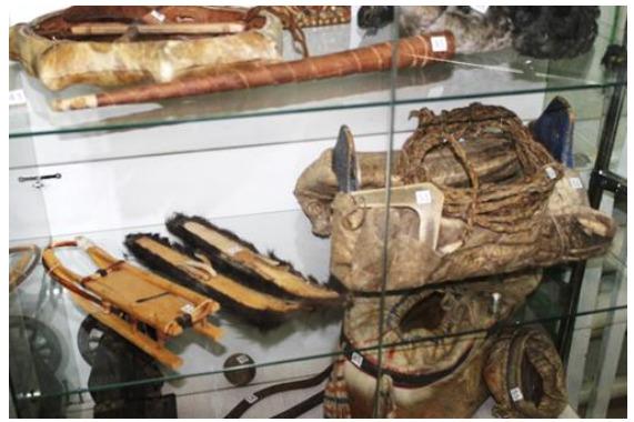
Олекминский район, Тянский национальный наслег. Экспонаты Тянского пришкольного музея